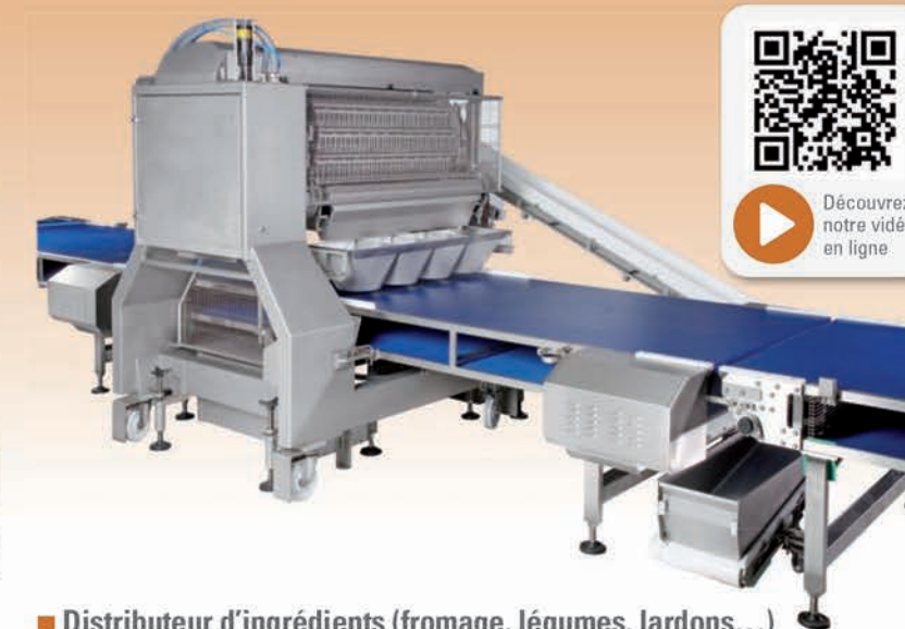
■ Distributeur d'ingrédients (fromage, légumes, lardons...)