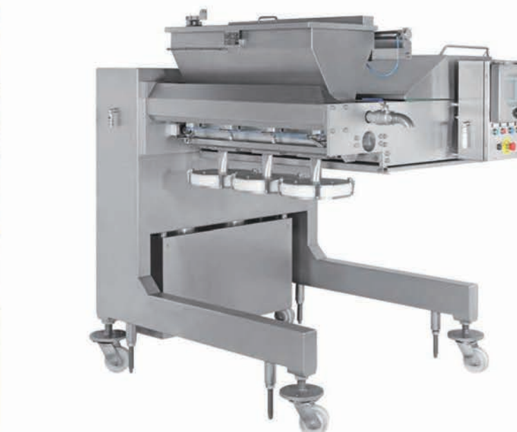
■ Conception sur roulettes pour une meilleure sanitation