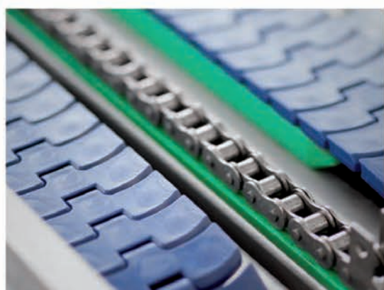
■ Système de convoyage de plaques