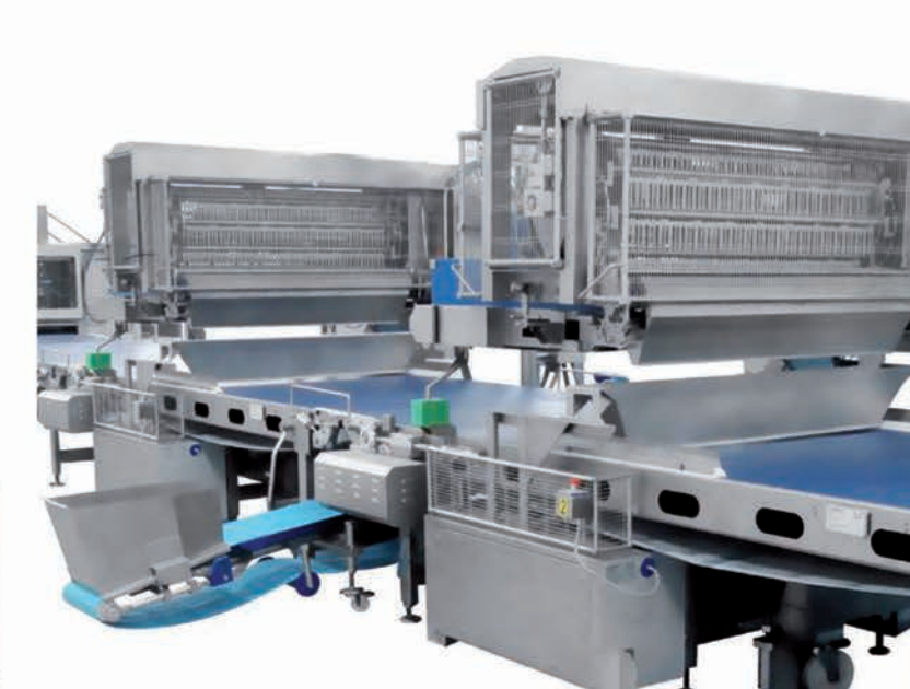
■ Distributeur d'ingrédients en continu avec récupération automatique du surplus