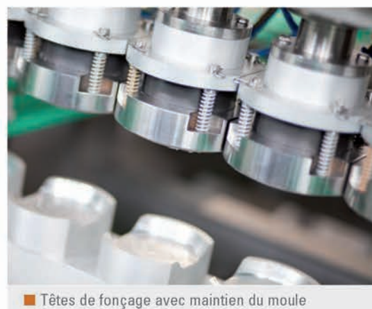
■ Têtes de fonçage avec maintien du moule