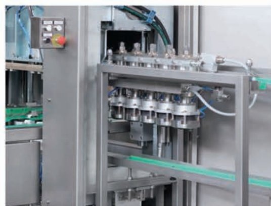
■ Extraction des têtes de fonçage sur le chariot