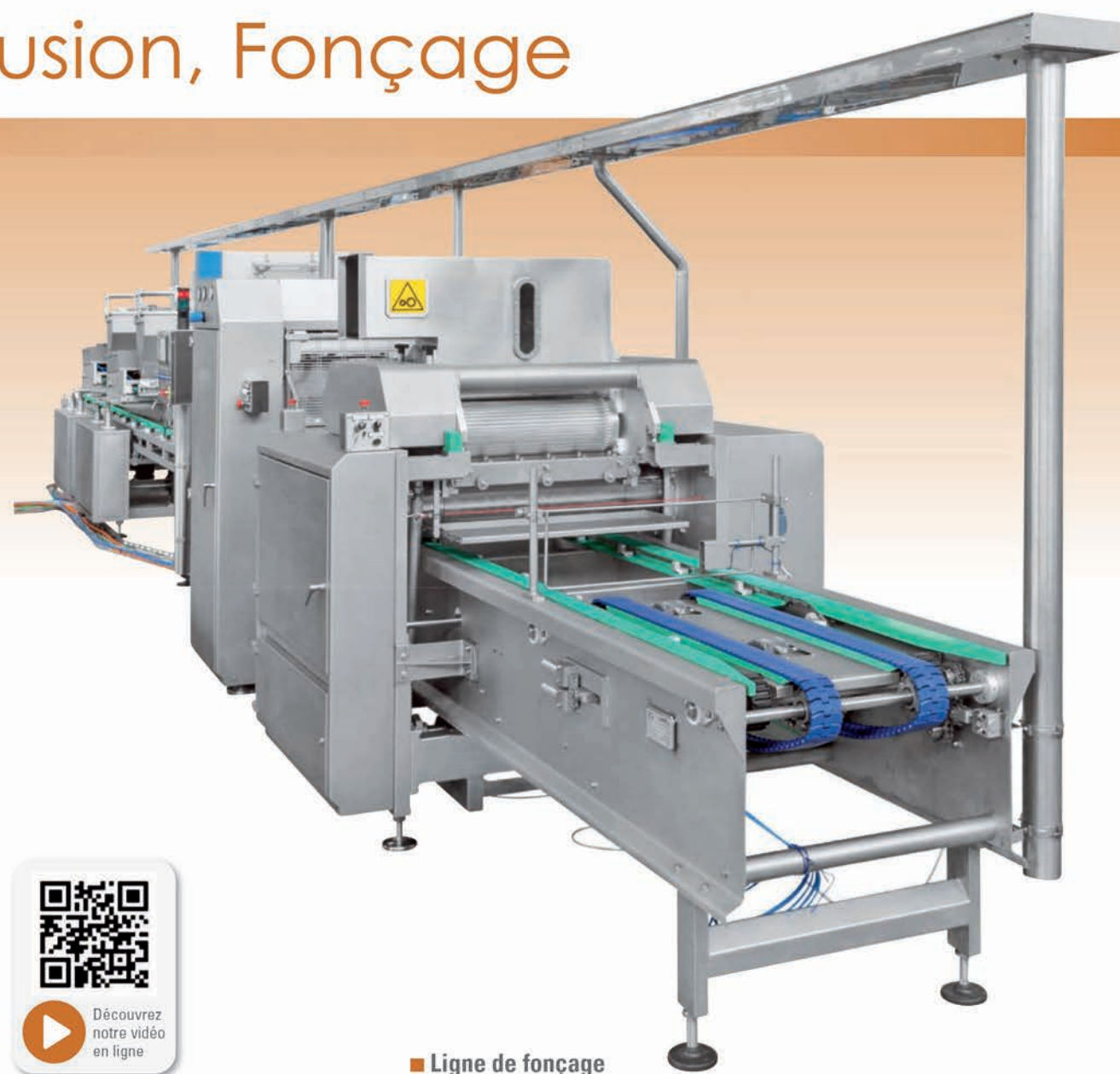
■ Ligne de fonçage