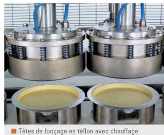
■ Têtes de fonçage en téflon avec chauffage