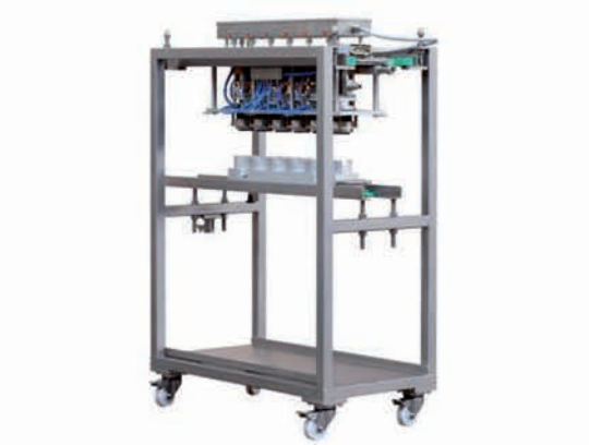
■ Chariot des têtes de fonçage