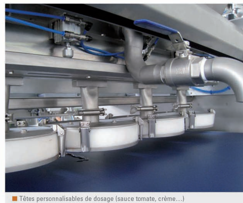
■ Têtes personnalisables de dosage (sauce tomate, crème...)