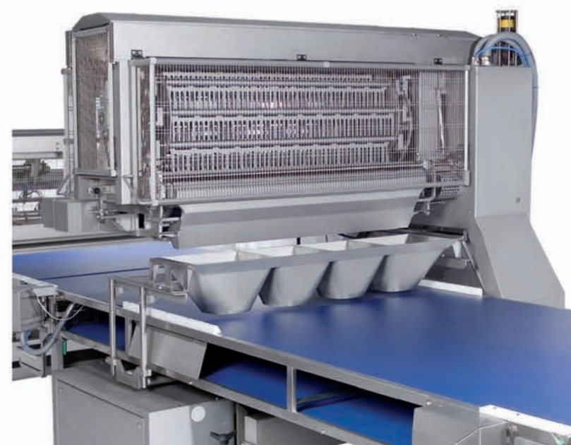
■ Distributeur d'ingrédients en continu avec systèmes de masques