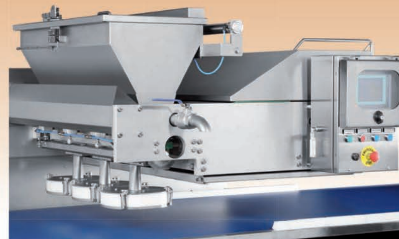
■ Ligne de dosage (sauce tomate, crème...)