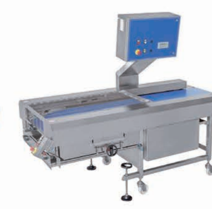
■ Tapis de dépose automatique sur plaque