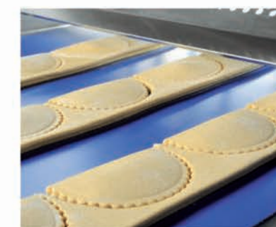
■ Découpes matrice chaussons