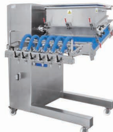
■ Doseuse vis inclinée