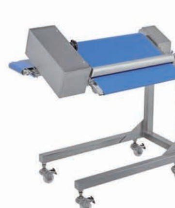
■ Tapis retour rognures