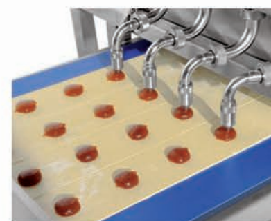
■ Dosages spots