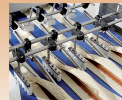
■ Sabots de pliage