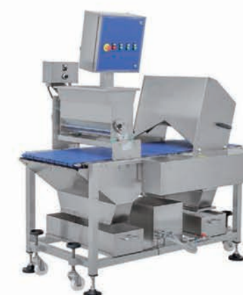
■ Doreuse à disques