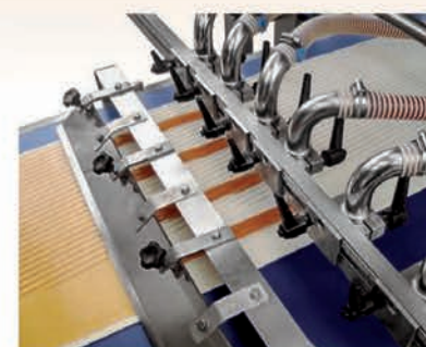
■ Lames d'étagage