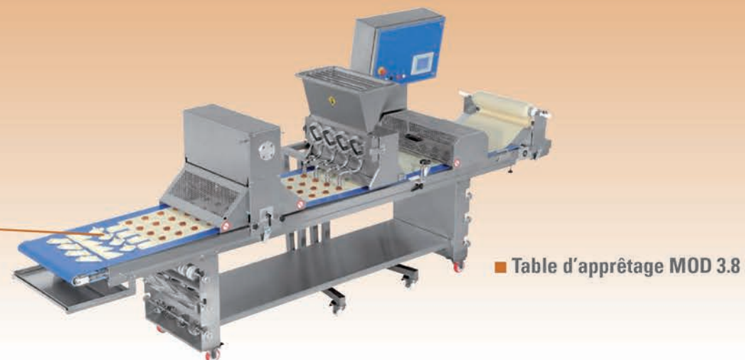
■ Table d'apprêtage MOD 3.8