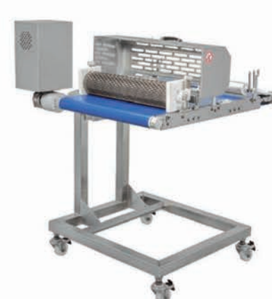
■ Double abaisse