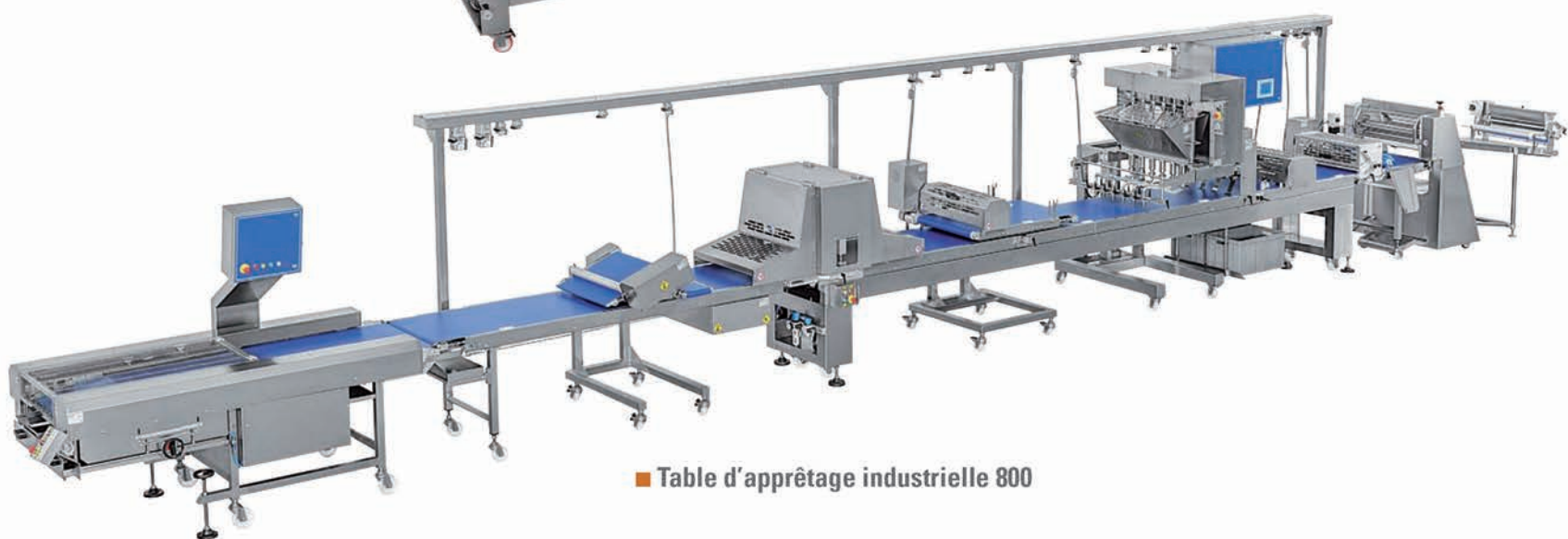
■ Table d'apprêtage industrielle 800