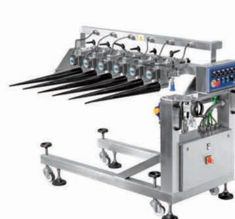
■ Enrouleurs multiples