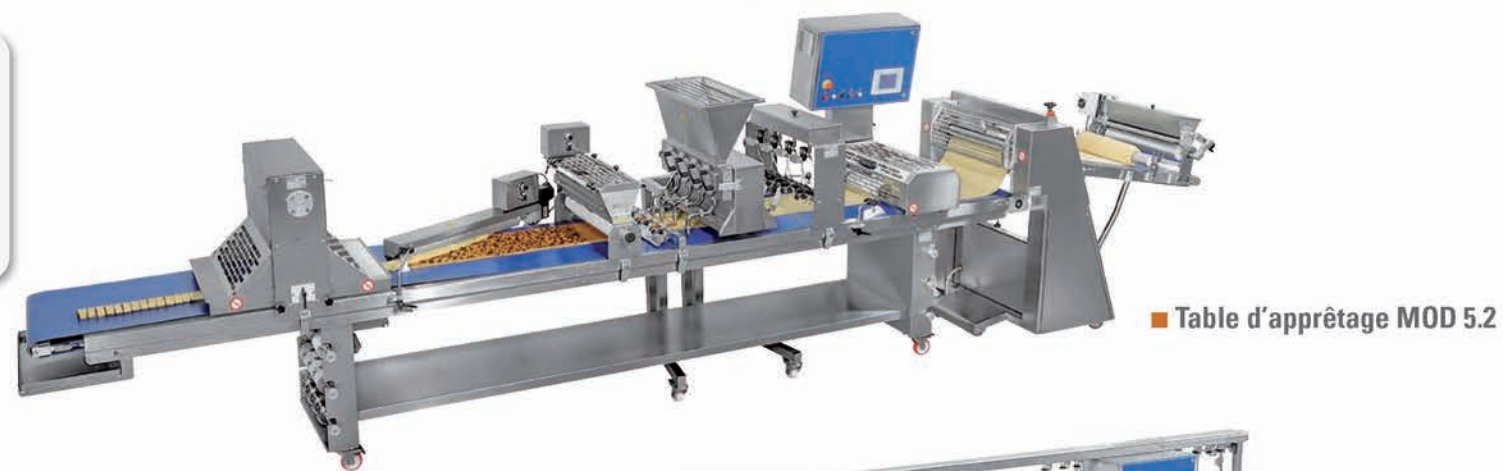
■ Table d'apprêtage MOD 5.2