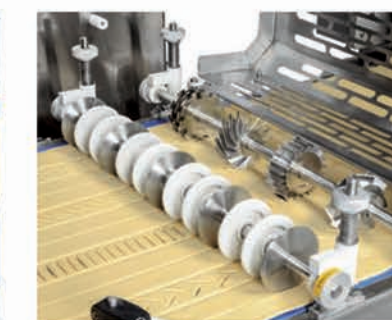
■ Rouleaux de décor