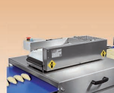
■ Façonneuse manuelle croissants