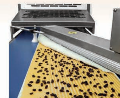
■ Cône d'enroulement