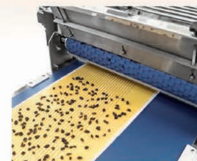
■ Distributeur marquants