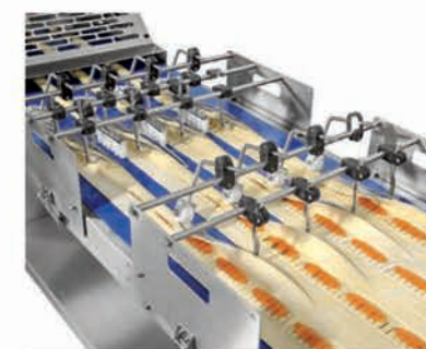
■ Dosages intermittents