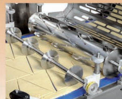
■ Découpe rotative croissants