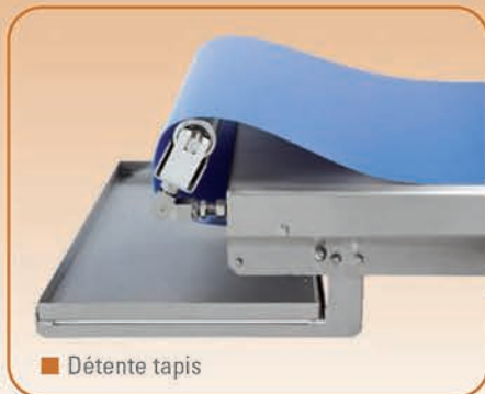
■ Détente tapis