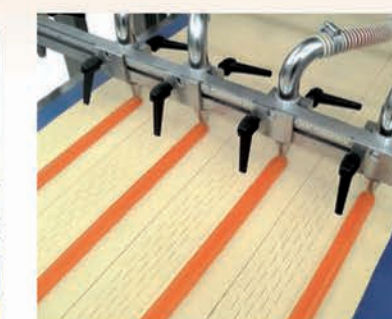
■ Dosages continus